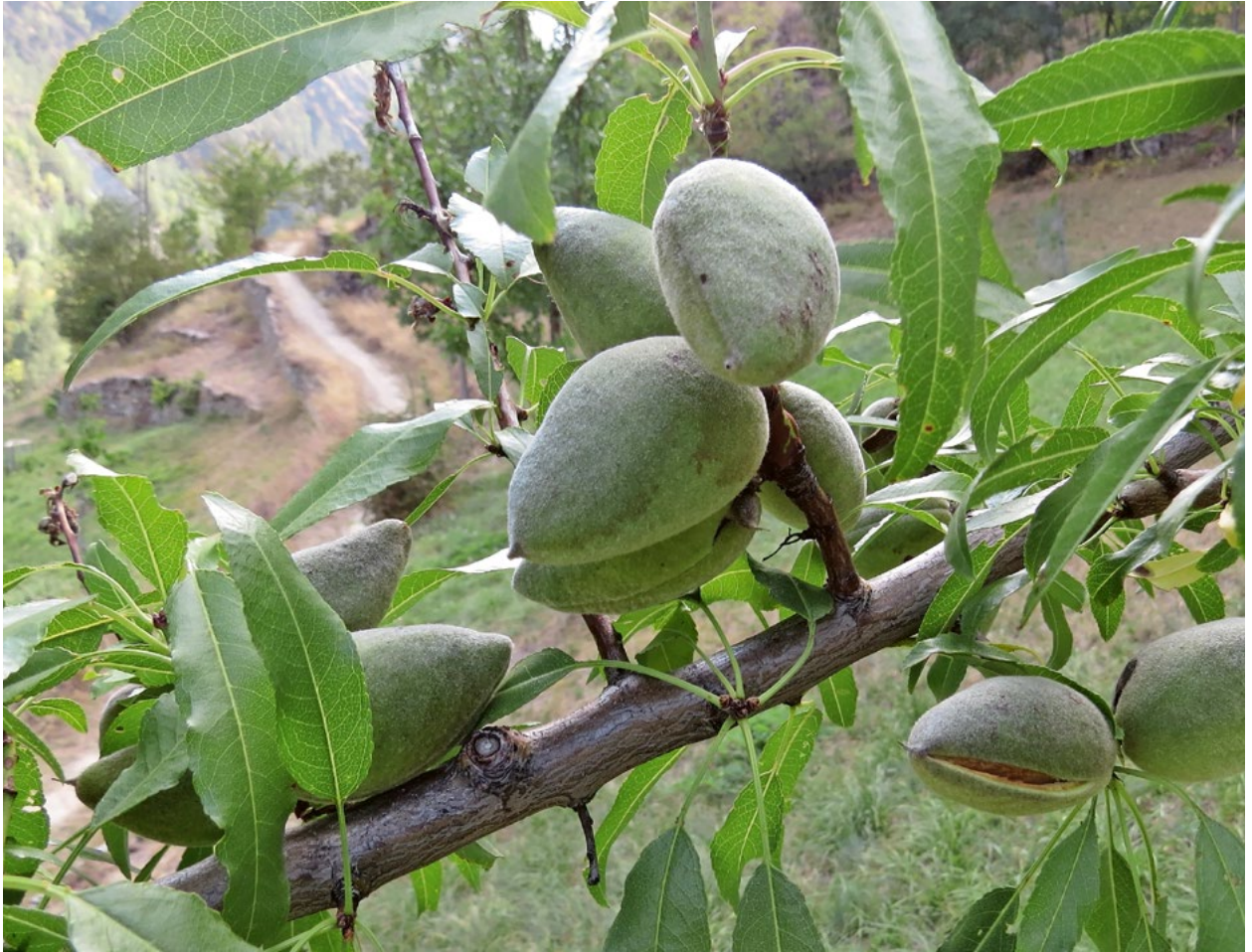
Der Stein der ganz früh geernteten grünen Mandel ist noch weich, fast gallertartig.

über den Baum erfahren. Rund 100 Mandelbäume hat er gesetzt, einige davon sind bereits 25 Jahre alt. Wirtschaftlich sei der Ertrag bislang bescheiden, sagt er, doch für ihn stehe das Gesamtprojekt im Vordergrund: «Mich interessiert, welche Sorten sich eignen und welchen Einfluss Mandelbäume auf die Biodiversität haben.» Früh blühende Bäume bieten Insekten eine wichtige Nahrungsquelle – allerdings sind sie auch spätfrostgefährdet, was im alpinen Raum ein zentrales Risiko darstellt.